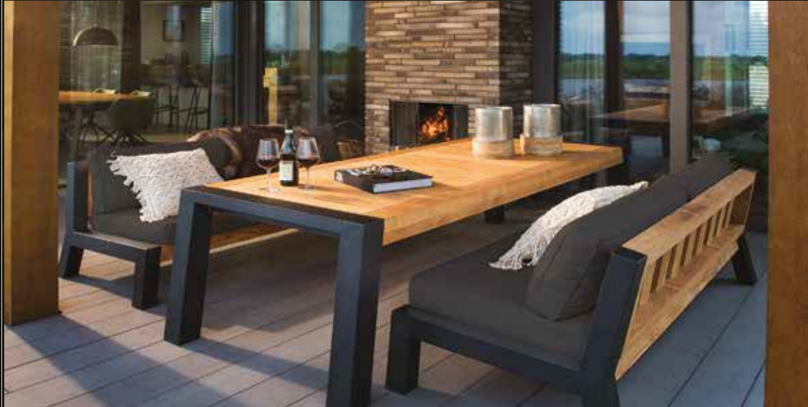
Bellevue low dining set, gepoedercoat aluminium frame gecombineerd met teakhout. De tafel is 240 x 100 x 67 cm. De banken zijn 200 cm breed.

Mooie comfortabele en betaalbare tuinmeubelen. Een kleurrijke collectie met oog voor detail. Design meubelen voor ieder budget. Kom naar onze mooie showroom en laat u informeren en inspireren!