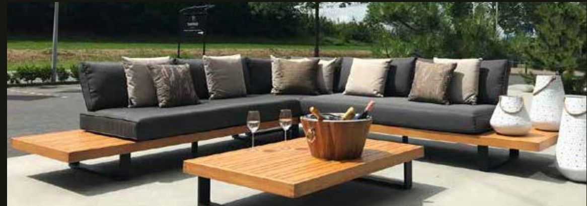
Modulaire loungeset CALMA, bestaande uit chaise longue links en rechts 231 x 88,5 cm, hoekdeel 88,5 x 88,5 cm, rechthoekige tafel 137 x 88,5 cm, vierkante tafel met kussen, te gebruiken als poef 88,5 x 88,5 cm. Tussenstuk 88,5 x 88,5 cm, ook te gebruiken als losse stoel. Poef en tussenstuk samen te gebruiken als 1 persoons ligbed.