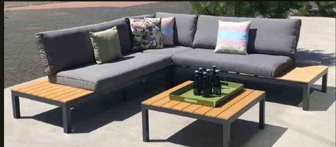
Michigan 4-delige loungeset. Gepoedercoat aluminium met polywood (teak kleur). Hoekopstelling 249 x 249 cm, tafel 80 x 80 cm. Deze set is eenvoudig zelf te monteren.